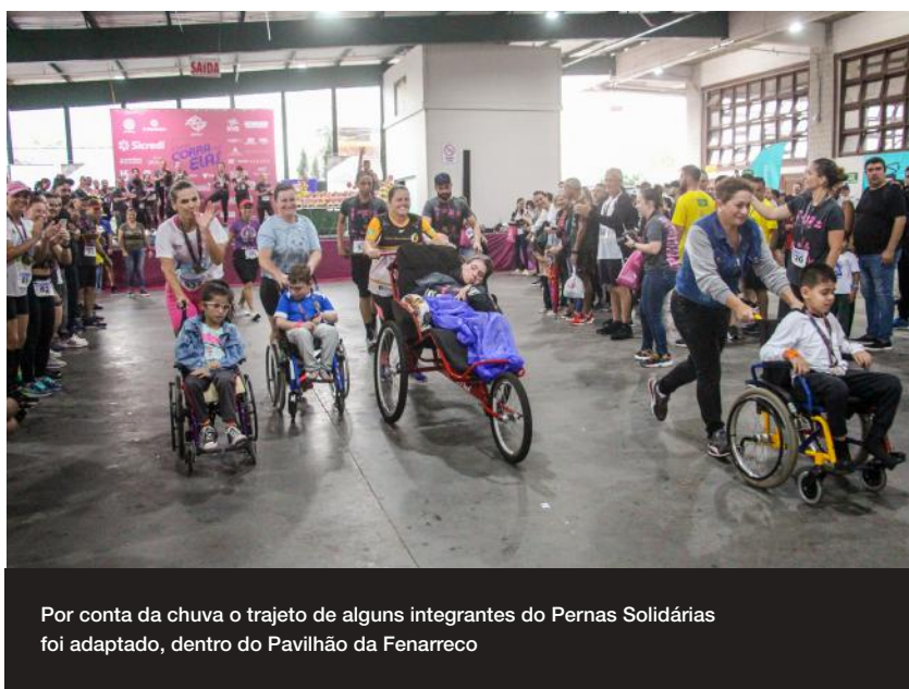
Por conta da chuva o trajeto de alguns integrantes do Pernas Solidárias foi adaptado, dentro do Pavilhão da Fenarreco

As expectativas são de que em 2023 o evento possa ser realizado novamente, com data a confirmar.