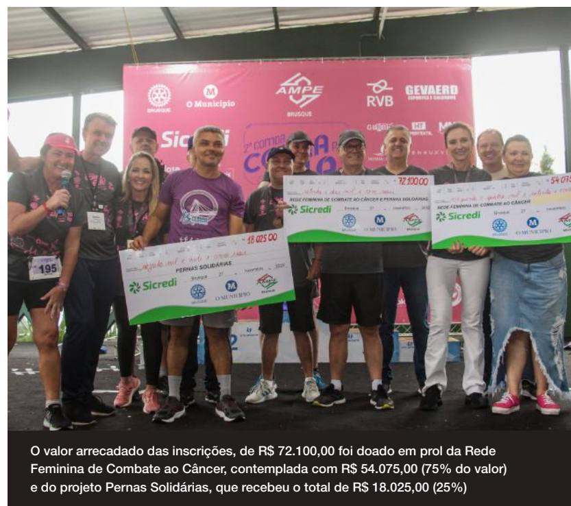
O valor arrecadado das inscrições, de R$ 72.100,00 foi doado em prol da Rede Feminina de Combate ao Câncer, contemplada com R$ 54.075,00 (75% do valor) e do projeto Pernas Solidárias, que recebeu o total de R$ 18.025,00 (25%)

Além da premiação para os cinco primeiros colocados nas categorias feminino e masculino de cinco e dez quilômetros, o evento também fez entrega de troféus para os cinco primeiros colocados por idade, de cinco em cinco anos. Todos os participantes ganharam medalhas, incluindo os da caminhada e corrida kids. Os grupos de assessorias de corridas e empresas que