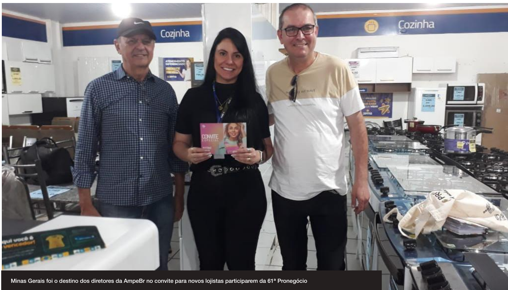
Minas Gerais foi o destino dos diretores da AmpeBr no convite para novos lojistas participarem da 61ª Pronegócio

Como forma de ampliar a divulgação da Pronegócio e convidar pessoalmente lojistas de outros locais do Brasil para a próxima edição do evento, a Associação das Micro e Pequenas Empresas de Brusque e Região (AmpeBr) deu início a mais uma fase de viagens de prospecção.