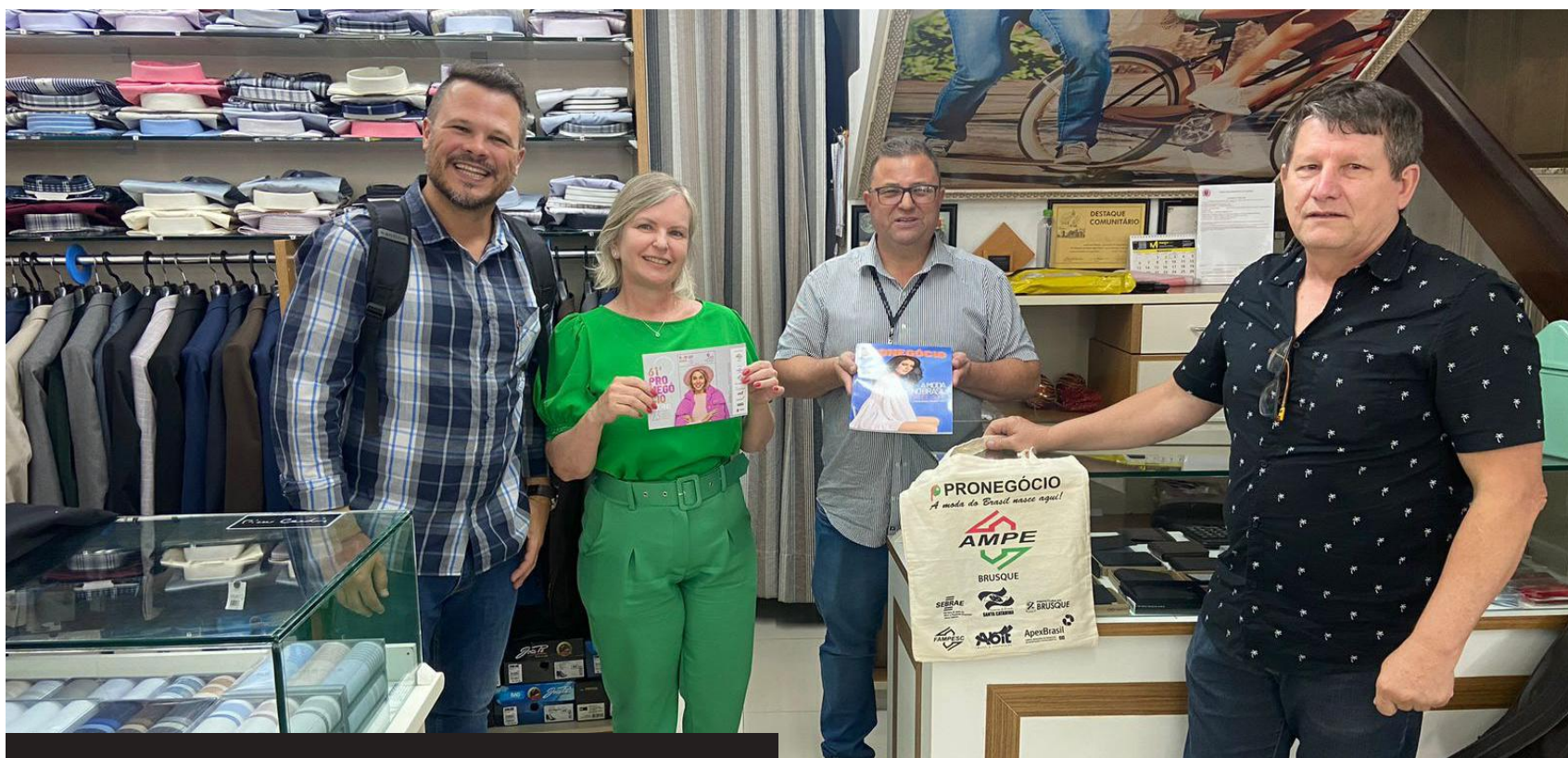
A região de Curitiba, no Paraná, também foi visitada pelos diretores da AmpeBr, no convite a novos lojistas para a maior rodada de confecção do país

recebidos pelos lojistas, e alguns, inclusive, demonstraram interesse em participar da nossa rodada. E esses convites continuam sendo muito importantes, para que novos compradores possam participar do evento e conhecer o potencial da Pronegocio”, comentou Emerim.